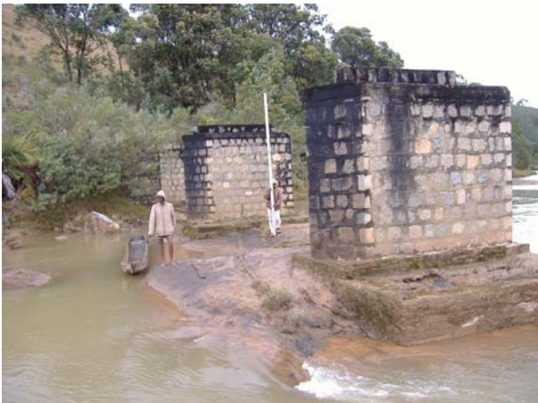
Le pont Tratrambolo tient une importance capitale dans le désenclavement des Communes bénéficiaires qu'elles étaient prêtes à tout faire pour la prise en charge de sa réhabilitation après passage du cyclone.

Durant cette année, Lalana a fourni son expertise sur les documents présentés et sur les problèmes évoqués par les Communes bénéficiaires relatives aux différentes phases des travaux routiers.