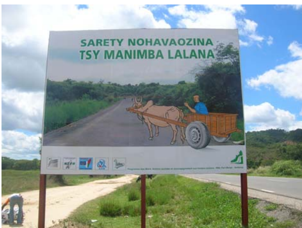
La vulgarisation des charrettes améliorées (à roues pneumatiques, ou avec des bandages en caoutchouc) constitue une activité que Lalana voudrait généraliser sur le territoire national pour la préservation de la route.