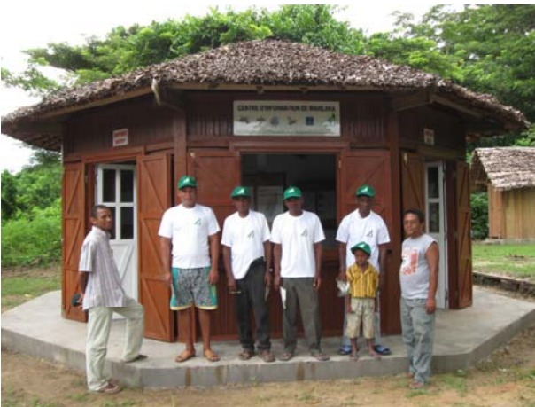
Les membres de l'association MAHIRATRA qui vont gérer le Centre d'information du site archéologique de Mahilaka : le transfert de compétence prime sur la dotation des équipements.

Le projet a pris fin en septembre 2008, néanmoins une équipe restreinte est restée sur place pour assurer le suivi des actions initiées et pour préparer les réceptions définitives qui ont eu lieu cette année.