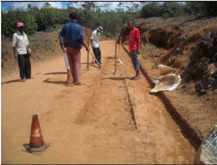
Pour pouvoir diriger leurs équipes, les chefs cantonniers doivent maîtriser l'exécution des différents types des travaux d'entretien routier.

Les formations octroyées comprenaient des cours théoriques et des travaux pratiques d'assimilation sur le terrain aussi bien pour les agents des ministères que pour les bureaux d'études et entreprises.